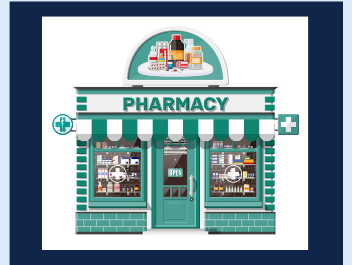
ഒരേ ഫാർമസിയിൽ നിന്ന് വാങ്ങുക