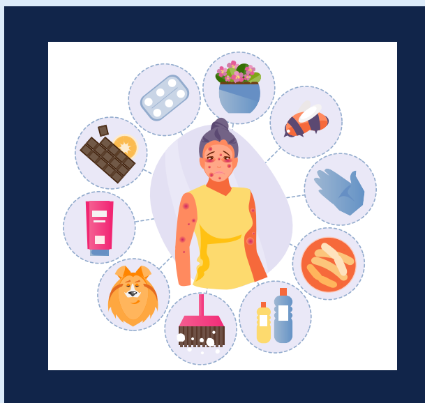
അലർജിയും വശവും അറിയിക്കുക - ഡോക്ടർക്കുള്ള പ്രത്യാഘാതങ്ങൾ