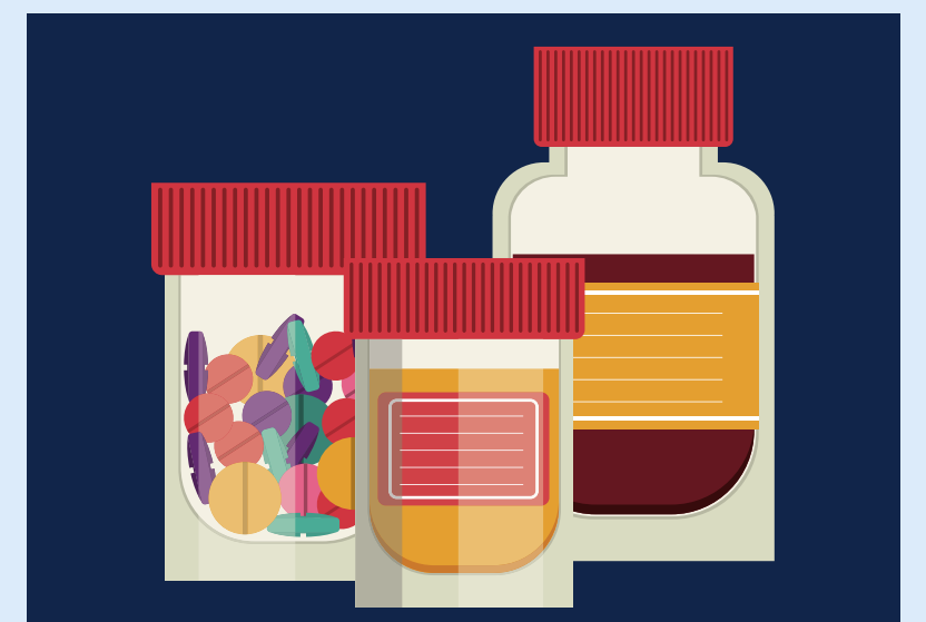
നിങ്ങളുടെ മരുന്നുകൾ മറ്റുള്ളവർക്ക് നിർദ്ദേശിക്കരുത്