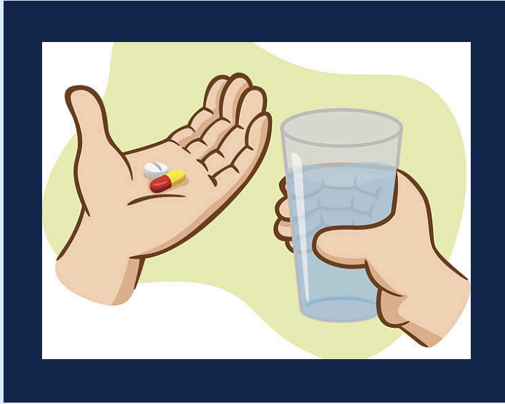
സ്വയം മരുന്ന് കഴിക്കരുത്