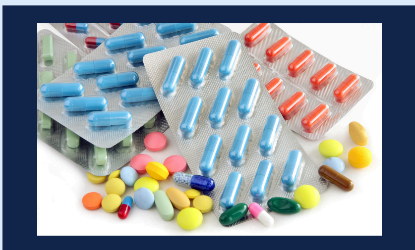
സാധാരണ മരുന്നുകളുടെ സ്റ്റോക്ക് സൂക്ഷിക്കുക