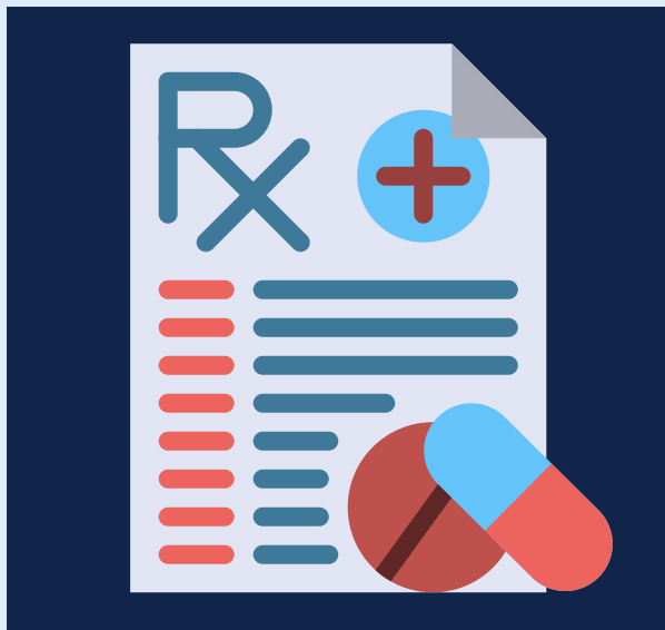
കുറിപ്പിയിലെ നിർദ്ദേശങ്ങൾ പാലിക്കുക